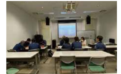
新しい就業規則の周知を目的にした社内勉強会