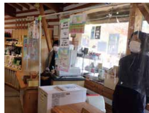
道の駅物産館のレジに立つ従業員