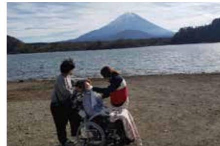
利用者様の山梨への家族旅行にスタッフが同行