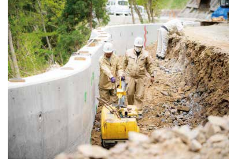
林道工事で先輩社員から指導を受ける実習生