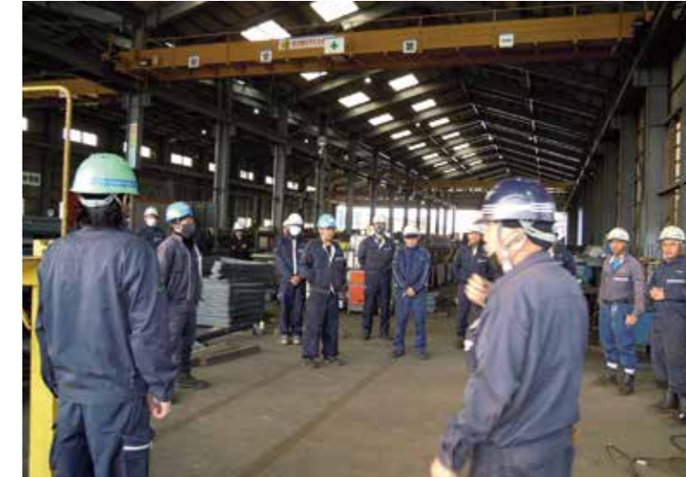
準備体操後に行っている朝のミーティング