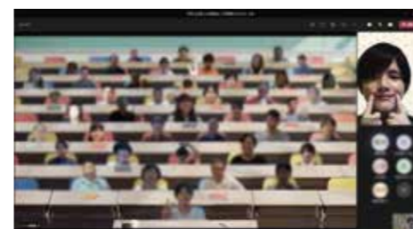
ビデオ会議システムを利用した新入社員歓迎会