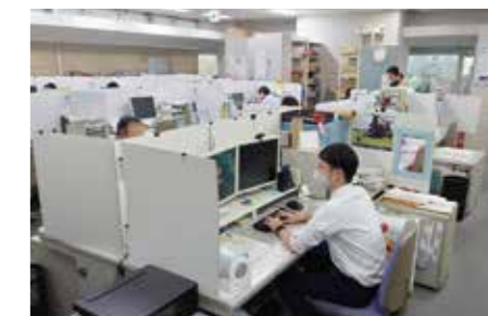
日本非破壊検査協会の職場