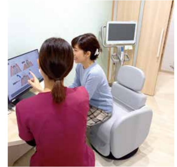
患者へのカウンセリング