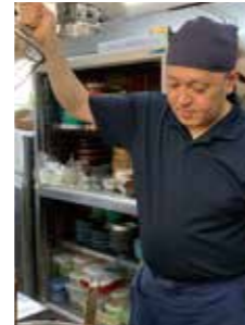
店内での調理作業