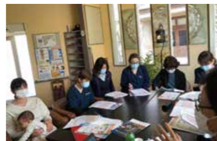
育児休業中の職員も参加した制度改正説明会