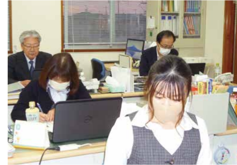
土日休の完全週休2日制を実現した社内