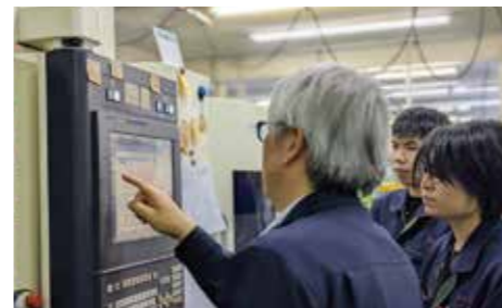
金型パーツの加工機械設備の使用方法を指導

今回、内容が具体化され評価してもらえるようになり、さらに働きがいを感じられるようになった。