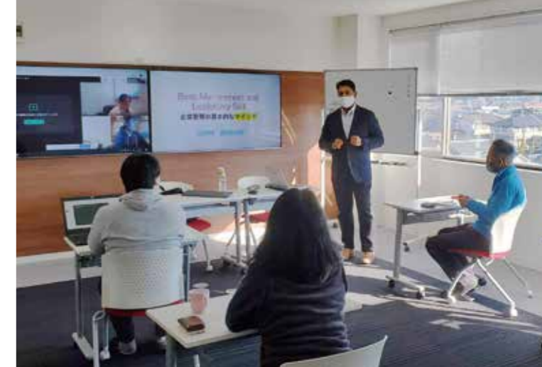
在宅勤務者も社内会議にオンラインで参加