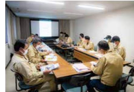
社内で行われている安全衛生会議

昇給・賞与に差がついたことで、技能や努力を評価してもらえることが実習生にも伝わった。最初は出来なくても、頑張る人を見ながら自分も頑張りはじめた実習生も出てきた。