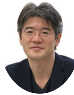
水町 勇一郎 東京大学教授

「効率化・改善」部門では4社が選定された。共栄(P26)は仕事の「見える化」を「共有化」につなげる動きが注目される。島崎歯科医院(P22)は、業務の無駄を職員と一緒に洗い出した社内コミュニケーションが優れている。システムクス(P28)が導入した社員の能力向上を促進して会社の業績につなげる評価賃金制度と、TSSソフトウェア(P24)のテレワークを推進する総合的な対応は、いずれも参考になる事例だ。