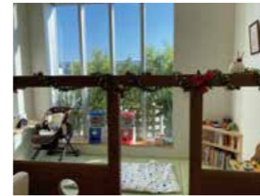
子育て支援ルーム

教育訓練休暇制度の導入により希望する研修等を受講する際に、年次有給休暇の日数を減らさずに休暇が取れるため、仕事とプライベートをうまく両立できるようになった。