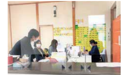
仕事のやり方についていろいろな意見が出て 合理化が進んだ鈴生ハウジングの職場