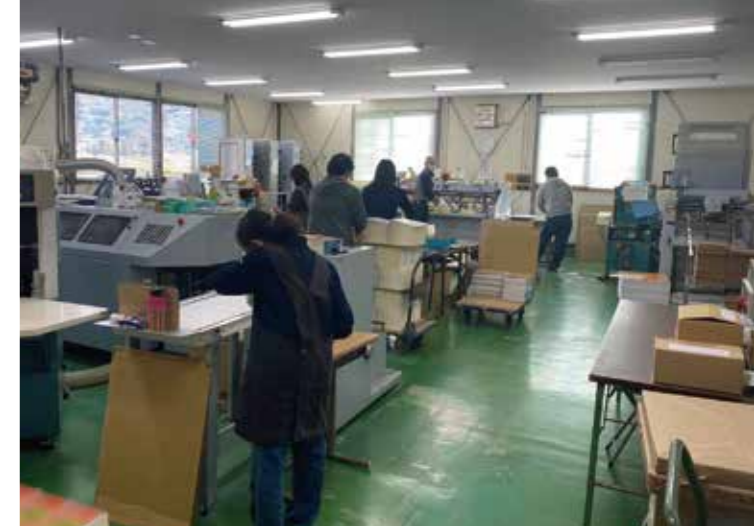
製本部で品質チェックに取り組む社員