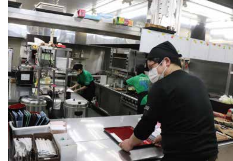
入浴施設「小菅の湯」にある飲食店の調理場