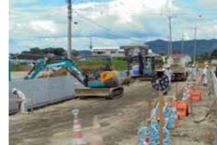
道路築造工事の土工作業風景

休日、休暇の見直しに当初不安はあったが、年次有給休暇が足りない者には、会社が有給の特別休暇を認め、5月連休、8月のお盆休み、年末年始の休みも従来通り休めたため、大変良い見直しだった。