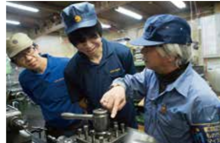
ベテラン従業員が若手を指導