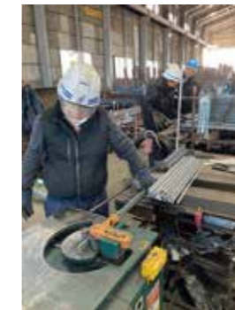
鉄筋材料の加工作業

工場での長時間労働の偏りをなくし、作業員全員で作業を終わらせることにより、今まで以上に連帯感が芽生えてきている。