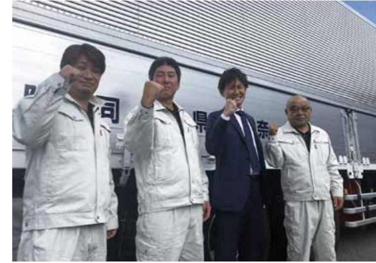
労務管理の改善やシステム変更に一丸となって取り組む