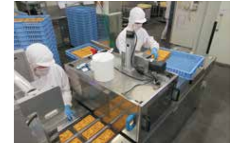
厚焼き卵の製造作業