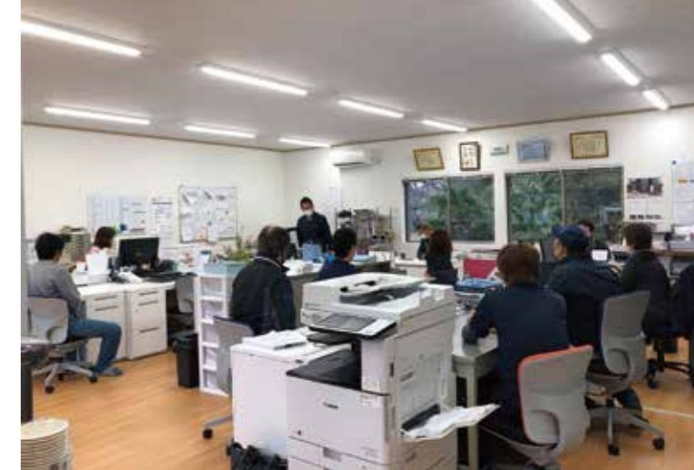
営業所で行われている朝礼