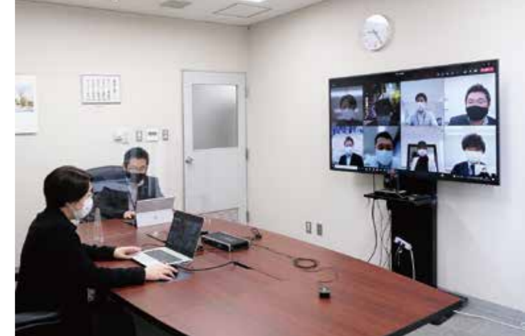
テレワーク導入により機会が増えたオンライン会議

テレワークの推進によってワークフローシステムやオンライン申請のような新しいシステムが導入され、書類郵送業務の削減など業務が効率化したことで負担も軽減したと感じている。