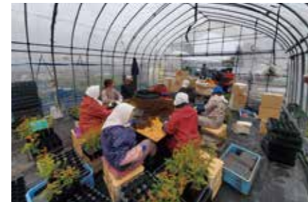
働き方改革の推進により生産性が向上し、 活気が出てきた施設栽培風景