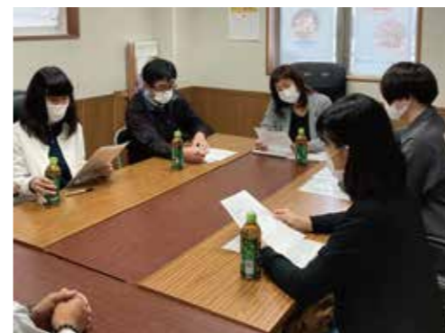
営業会議で話し合いを進めるスタッフ

手当や労働時間、業務内容について経営層と話がしやすくなった。コロナ禍でこの先不安だったが、手当などの基準が明確になり、業務への取り組み方が見えてきてモチベーションも上がったと思う。