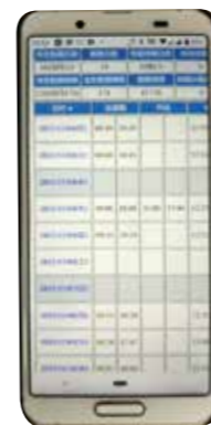
フレックスタイム制度に対応した 自社開発の勤怠システム