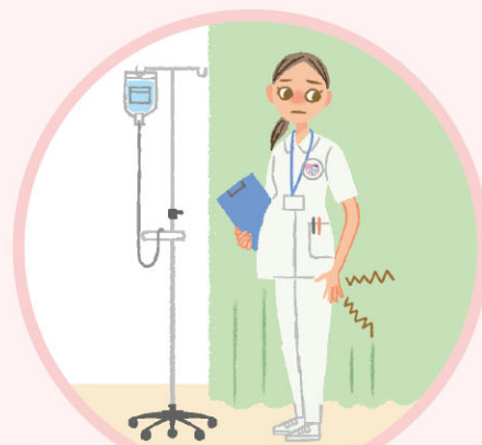
足がむくみ、 立ち作業が続けられない