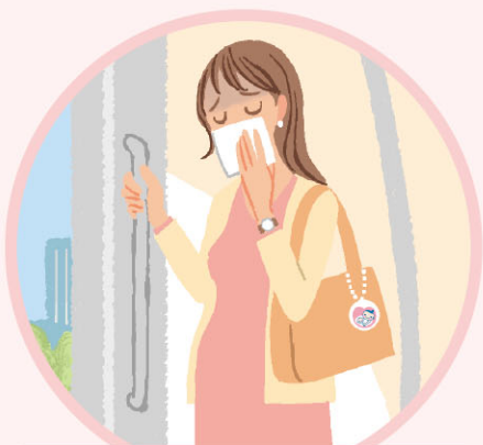
通勤中の つわりが辛い