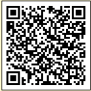
ကျန်းမာရေးအလုပ်သမားနှင့်လူမှုဖူလုံရေးဝန်ကြီးဌာနဝက်ဘ်ဆိုဒ်

လုပ်ခလစာကို ဒစ်ဂျစ်တယ်စနစ်ဖြင့် ပေးချေမှု၏ အသေးစိတ် နှင့် ကျန်းမာရေး၊ အလုပ်သမားနှင့် လူမှုဖူလုံရေးဝန်ကြီးမှ သတ်မှတ်ထားသည့် ငွေလွှဲဝန်ဆောင်မှုပေးသူ (အသိအမှတ်ပြု ငွေလွှဲဝန်ဆောင်မှုပေးသူ) ကို ကျန်းမာရေးအလုပ်သမားနှင့် လူမှုဖူလုံရေးဝန်ကြီးဌာနဝက်ဘ်ဆိုဒ် “အသိပေးစာတမ်း” ၊ “သတ်မှတ်ထားသည့် ငွေလွှဲဝန်ဆောင်မှုပေးသူစာရင်း” စသည်တို့တွင် ကိုးကားကြည့်ရှုပါ။