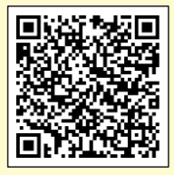
គេហទំព័ររបស់ក្រសួងសុខាភិបាលការងារ និងសុខុមាលភាព

សម្រាប់ព័ត៌មានលម្អិតទាក់ទងនឹងប្រព័ន្ធទូទាត់ប្រាក់ឈ្នួលតាមប្រព័ន្ធខីជិថល និងភ្នាក់ងារផ្ទេរប្រាក់ដែលកំណត់ដោយរដ្ឋមន្ត្រីក្រសួងសុខាភិបាលការងារ និងសុខុមាលភាព(ភ្នាក់ងារផ្ទេរប្រាក់ដែលបានកំណត់)សូម ចូលទៅកាន់គេហទំព័ររបស់ក្រសួងសុខាភិបាលការងារ និងសុខុមាលភាព "ឯកសារព័ត៌មាន" "បញ្ជីភ្នាក់ងារផ្ទេរប្រាក់ដែលបានកំណត់" ល